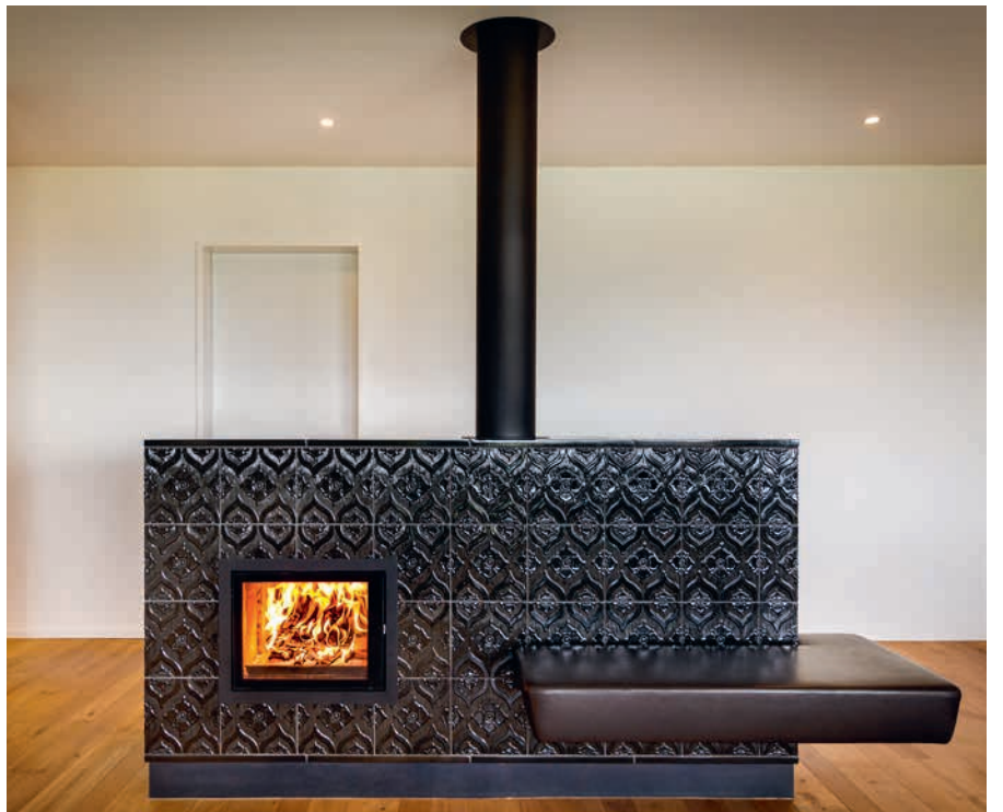
Ofenbauer: die mansers ag